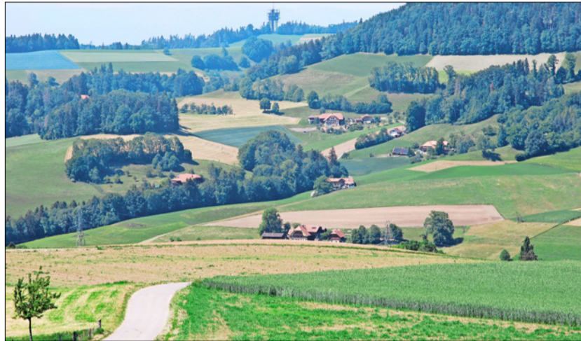
Wenn die SAK-Mindestgrenze in der Tal- und der Hügelzone angehoben würde, fielen laut dem BLW 2100 Betriebe aus der Direktzahlungsberechtigung. (Bild: sjh)

«Im kommenden Herbst wird der Bundesrat die Vernehmlassung mit Änderungsvorschlägen eröffnen, so dass alle Organisationen und Kantone ihre Stellungnahme dazu abgeben können», so Florie Marion vom BLW. Das BLW führt weiter aus: «In den bisherigen Diskussionen wurde eine Erhöhung nur für Talbetriebe auf bis zu 0,5 SAK thematisiert. Bergbetriebe wären nicht betroffen. Eine Änderung der Eintrittsschwelle der